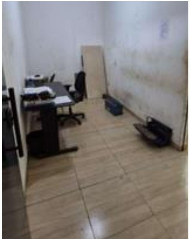
OFICINA – RONDONÓPOLIS-MT

Av. Gonçalo Antunes de Barros, 959 – Bosque da Saúde – Cuiabá-MT E-mail: natasha_wounnsoscky@hotmail.com - Contato: (65) 9.9670-9623