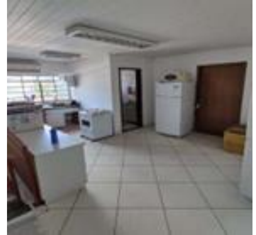
FILIAL DE RONDONÓPOLIS-MT