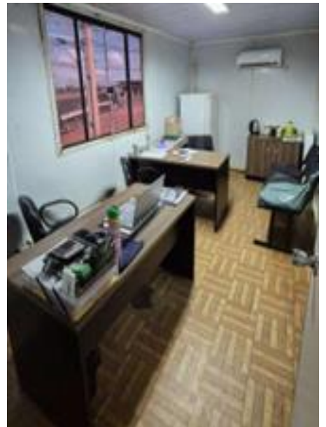
CONTÊINER – RONDONÓPOLIS-MT

Av. Gonçalo Antunes de Barros, 959 – Bosque da Saúde – Cuiabá-MT E-mail: natasha_wounnsoscky@hotmail.com - Contato: (65) 9.9670-9623