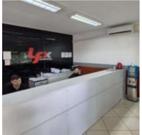
POSTO ALDO – RONDONÓPOLIS-MT