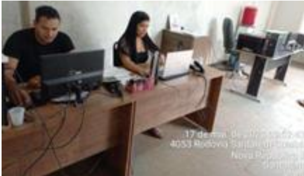
FILIAL ARAQUARI E PARANAGUÁ EM SANTAREM